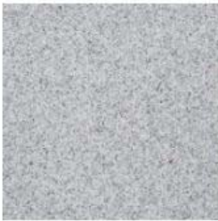
Dlažba vzor 065