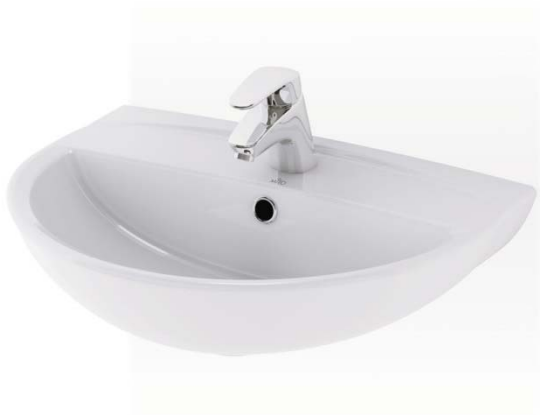
Umývatko klasické JIKA LYRA PLUS, 40 cm (wc väčších bytů), plastový sifon